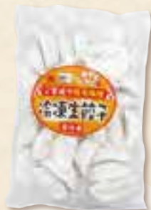
夢やまびこ豚で 作った 冷凍生餃子 (15g×30個、450g)