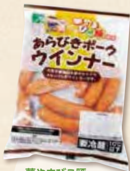
夢やまびこ豚 あらびき ポークウィンナー (220g)

マン肉詰め、生餃子と加工肉のウィンナー、ロースハム、ももハム。「奥三河どり輝」のむね肉を使用した味付け肉3種。いずれの商品もご家庭で簡単に調理していただけます。