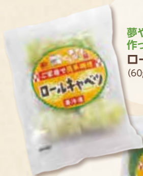
夢やまびこ豚で 作った ロールキャベツ (60g×5個、300g)

当社精肉売場で展開しております地元愛知県産のこだわりのお肉を使用したプライベートブランド商品を新発売いたしました。「 夢やまびこ豚 」を使用したロールキャベツ、ピー