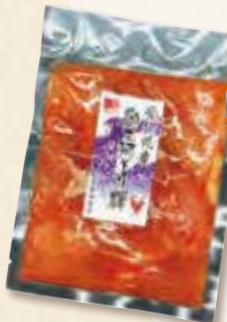
奥三河どり輝 むね味付け