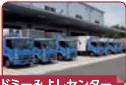
ドミーみよしセンター