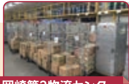
岡崎第2物流センター