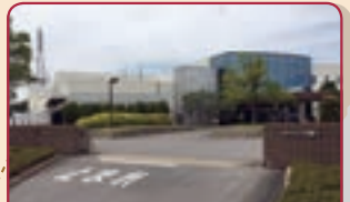
本社／岡崎食品加工センター