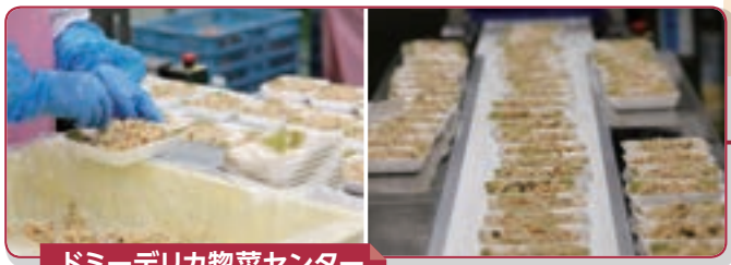
ドミーデリカ惣菜センター